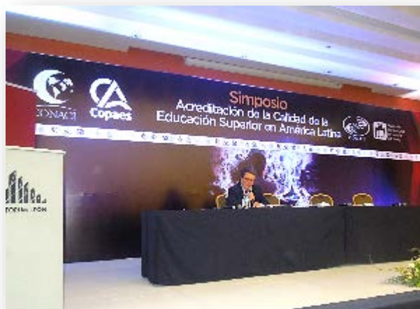
Jaime Alcalde Vicepresidente de la Comisión Nacional de Acreditación (CNA- Chile)